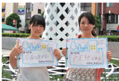
交通の便が良い (A.F) 戸定邸がある (Y.F)