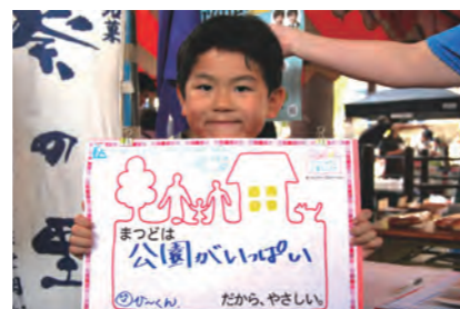
公園がいっぱい (ひ〜くん)