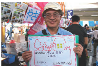
豊かな自然があって (エンちゃん)