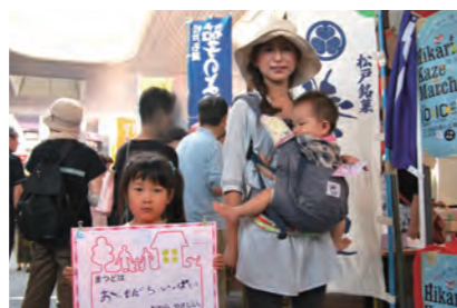
おともだちいっぱい (みんみ)