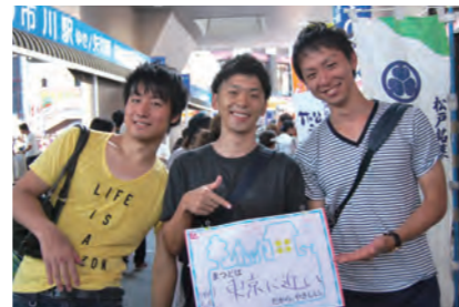
東京に近い (ひかり・もっち・おか G)