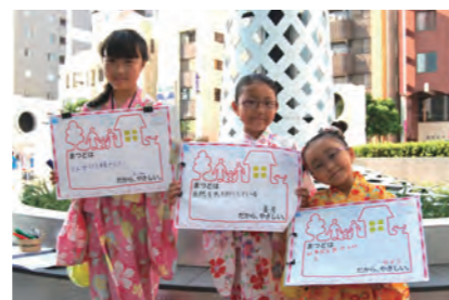
人がとても親切(ほーちゃん) 自然を大切にしている(美月) ひとがやさしい(ひより)