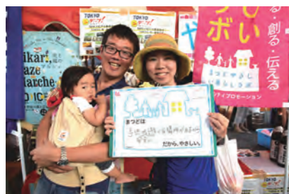
子供が安全に遊べる場所があるから (TOKU)