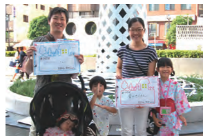
自然がたくさん 愛がたくさん