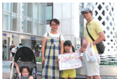
子供が遊ぶ場所が、たくさんある (コトハ)