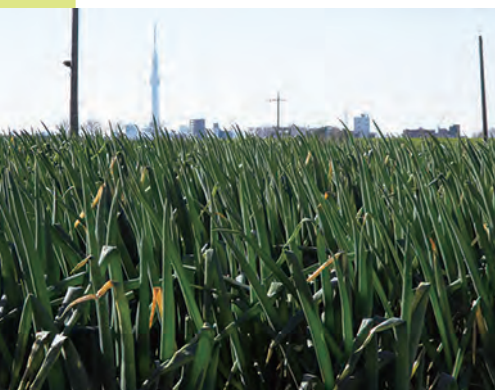
太くて甘み抜群、高級品として人気の「矢切ねぎ」。ねぎ畑の向こうには、東京スカイツリーが見える