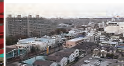
数多くのマンションが建ち並ぶ新松戸駅西口エリア。マンションごとの自治会の活動もさかんで、お子さん同士が仲良く遊ぶ姿も!

新松戸駅は日比谷や表参道などへ乗り換えなしで行けるJR常磐線各駅停車(東京メトロ千代田線)と、JR武蔵野線が交差していて、どこへ行くにもアクセス便利。大型スーパーや小売店が多く、公園や学校・青少年会館などの施設も揃っていてファミリー層からの支持が高いエリアです。お隣りの馬橋駅周辺はお団子やさんやおせんべいやさん、歴史あるお寺などがあり、お散歩が楽しいエリア。市役所の支所や、お子さんが病気の時でも預けられる病児・病後児保育室「ニコニコルーム」が駅の近くに揃っているので便利です。