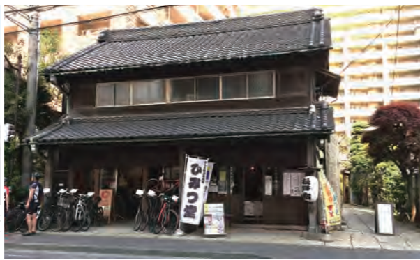
古民家・旧原田米店の一角で、松戸の歴史や見どころ・食事処などを教えてくれる、松戸の観光案内所「ひみつ堂」