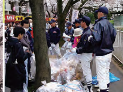
大にぎわいの常盤平さくらまつりでは、近隣の中学校や高校・ボーイスカウトのみなさんが清掃ボランティアとして活躍