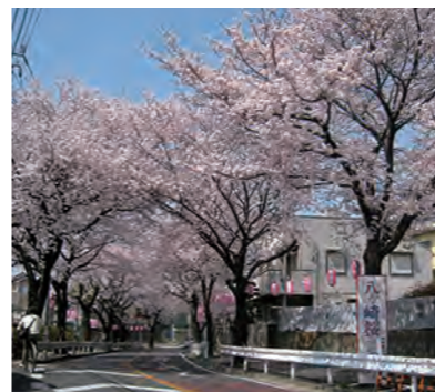
馬橋駅東口から徒歩15分ほど。国道6号線の八ヶ崎交差点から続く八ヶ崎の桜並木