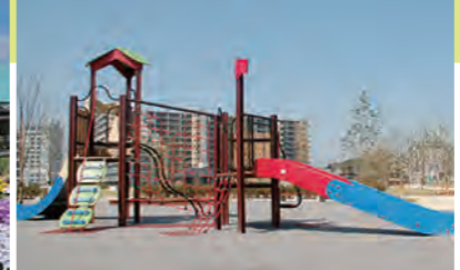
東松戸駅から徒歩約8分の「東松戸ゆいの花公園」は、花いっぱいの癒やしスポット。講座やイベントを定期的に開催(左)。駅から徒歩5分ほどの「東松戸中央公園」にある遊具は子どもたちのお気に入り！(上)