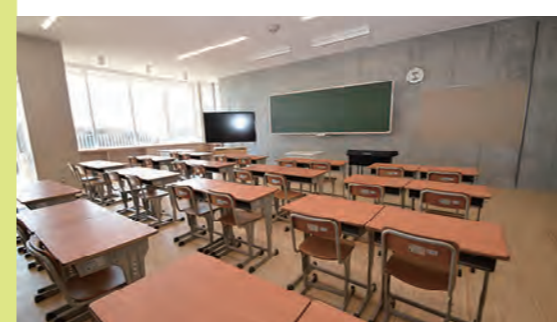
教室も机もピカピカ、デザインが光る東松戸小学校。子どもたちが大好きなプールは体育館上の4階部分に

JR武蔵野線と北総線の両方が利用できて、都心と成田・羽田空港へのアクセスの良さが人気の東松戸エリア。新しいマンションや新築の一戸建て、スーパーや飲食店が増えるなど、駅前の開発が日々進んでいて、子育てファミリーが急増中です。お子さんの増加に伴い、2016年4月には、松戸市内で29年ぶりとなる新設小学校「松戸市立東松戸小学校」が開校。子どもたちは、ピカピカの校舎で楽しい学校生活を送っているようです。近くには、季節の花々が美しい「東松戸ゆいの花公園」や緑いっぱいの森など、まだまだ多くの自然が残っています。