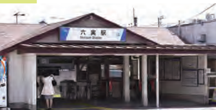
愛嬌が漂う六実駅。駅周辺には美味しいカフェやパン屋さんもある