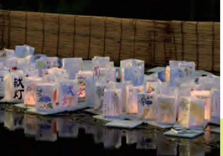
とうろう 灯籠は購入して、色をつけたりお願いごとを書いて、棧橋から流す。みんなが流した大切な灯籠は丁寧に回収され、後日、お焚き上げが行われる

都内をはじめとした各方面へ好アクセスの松戸駅。周辺には百貨店やスーパー、飲食店などが軒を連ね、市内外からの買い物客や通勤・通学する人などで賑わっています。徳川の住まい「戸定邸」をはじめ、「江戸時代には「松戸宿」という宿場町だった歴史あるエリア。大型店舗だけでなく、提灯屋さんや呉服店、和菓子屋さんなど、昔から続く商店も点在しています。そんな中、古い米蔵の建物を、若い芸術家たちがアトリエとして使っている「古民家スタジオ 旧原田米店」や、海外のアーティストが一定期間滞在して、地域と交流しながら作品を制作する場「PARADISE AIR」があり、歴史や伝統を大切にしながら、文化的な新しい挑戦にも熱心なエリアとして注目されています。御神輿や地域のお祭り・イベントなどでは、多世代交流も活発に行われています。また、駅周辺には「千葉大学園芸学部」と「聖徳大学・短期大学」があり、学生と地域が連携して、子どもたち向けのイベントも開催しています。