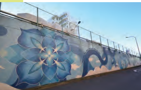
松戸駅西口の根本交差点近く、立体道路の側道の壁にアーティストが描いた「根本壁画通り」