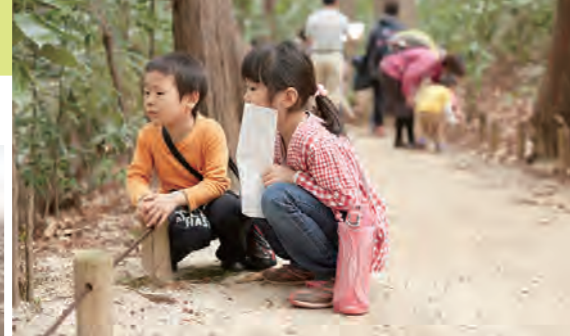
子どもたちが思いっきり走り回ったり、自然をじっくり観察することができるイベントが多く開催される「21世紀の森と広場」