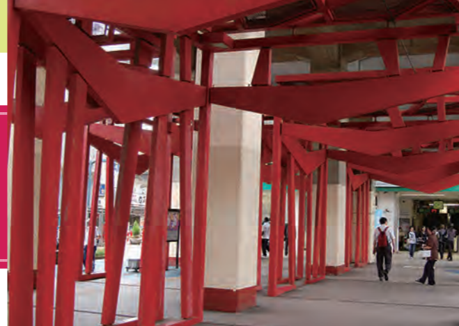
鳥居のような赤い鉄骨オブジェが印象的な新松戸駅前。スーパーや商店など、買い物や飲食に便利な他、総合病院やクリニックも揃う