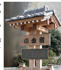
宿場町だったことから、名所旧跡が多いエリア。駅前には、小金宿の歴史が書かれている(右)。子育て中のママ・パパ向けのサポートサービスをする施設が入っている「ピコティ北小金」(左)