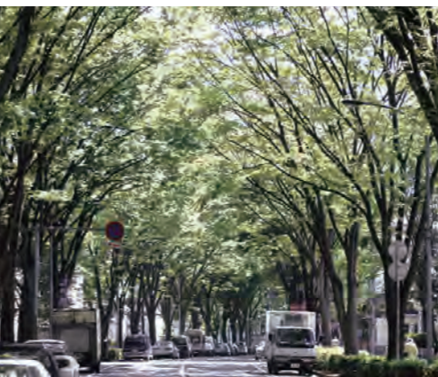
春は新緑、秋は紅葉が楽しめる「けやき通り」。雄大な樹形の美しさが、見る人の心をやわらげてくれる

「常盤平さくら通り」は、日本の道100選に選ばれている桜の名所で有名な常盤平。新・日本街路樹100景のひとつで緑が美しい「けやき通り」をはじめ、小さな通り沿いにも緑や季節の花を見ることができ、住む人の目を楽しませてくれます。市役所の支所や市民センター・図書館分館などの公共施設やスーパー、医療機関など、毎日の暮らしに必要な施設が揃っていて、住みやすさも魅力です。駅から徒歩10分ほどのところにある「常盤平児童福祉館」は、地域の子どもたちが集まる場。デイキャンプやお楽しみ会など、趣向を凝らした楽しい行事が目白押しです。