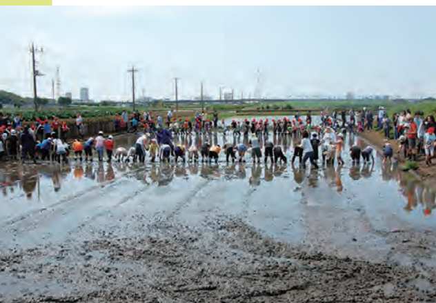
矢切小学校では、毎年児童全員で田植えをするのが春の伝統行事。秋にはお米を収穫して、みんなで美味しくいただきます。