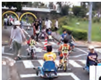
ユーカリ交通公園では、自転車やバッテリーカーを無料で利用できます。SLや消防車も置いてあって、子どもたちは大はしゃぎ!