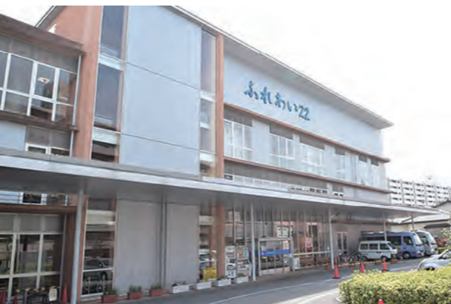
親子の遊び場やお子さんの発達についての相談や診療も行う「ふれあい22」(上)。毎年1回、松戸市内の子育て関連団体がここに集結して行うイベント「子育てフェスティバル」も大人気(下)

「常盤平さくらまつり」の会場としても知られる五香エリア。五香駅周辺にはスーパーや商店街が多く、毎日のお買い物や飲食に便利。駅から少し離れたところには、おしゃれなカフェも出店し、のんびり散策するのも楽しいエリアです。駅から徒歩15分ほどのところにある「ふれあい22(松戸市健康福祉会館)」には、子どもの発達についての相談場所であることも発達センターや、乳幼児の親子が集うおやこ広場も揃っていて、子育て中のママ・パパの強い味方。「商店街がいつばいあって生活に便利以上に、一戸建ての価格がお手頃だと思っ」と話すファミリーも。