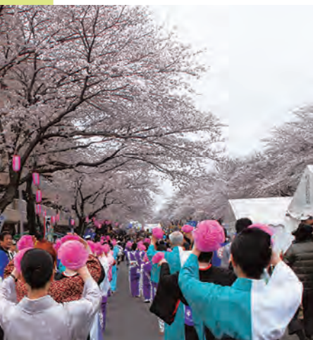
普段は往来の多い片側2車線の道路が、毎年桜まつりの2日間だけ「歩行者天国」に变身。イベントの他、フリーマーケットもズラリと並ぶ