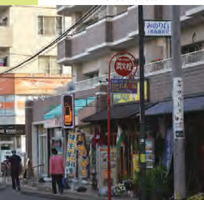
お買い物も飲食も。暮らしに必要なお店が揃い、人情味あふれる稔台の商店街