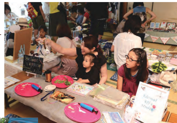
ママだけで出店したり、お子さんと一緒に出店したり。笑顔いっぱいのママたちが、元気に自分らしく活動中。MamaCan 会員は、正会員・サポーター会員・無料登録会員の3つの会員で構成。無料会員登録としてメールアドレスを登録するとイベント情報が配信されます。(HP/ http://mamacan-m.com/ 電話番号/ 080-7025-1403 メールアドレス/ contact@mamacan-m.com )