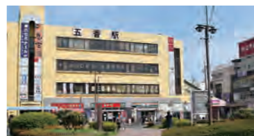
五香駅周辺には、いくつもの商店街が広がっていて、魅力的なお店が揃っている