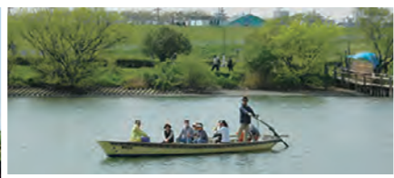
都内に唯一残る貴重な渡し場「矢切の渡し」。対岸の柴又とを結ぶ江戸川の渡し船